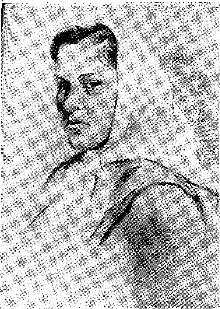
Худ. Ю. Хухров. Звельская Бегунова Ю. Г.