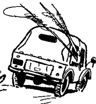
Рис. П. Муратова.

Н и один уважающий себя рыболов не станет губить выходной день на ужение рыбы вблизи города. Какая это ловля? Во-первых, рыбы здесь несравнимо меньше, во-вторых, природа либо изрядно обнищана, либо излишне причесана, в-третьих, — и это самое главное! — вместо успокоения нервной системы получишь нервный тик. Просто удивительно, как люди любят совать свой нос в чужие дела!